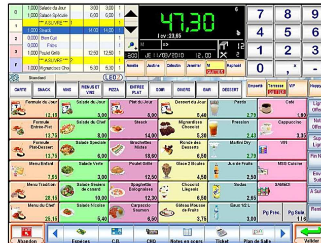
Ecran de caisse

Doseurs électroniques Télécommandes LEO Pocket et ORDERMAN®, LEO2 Gestion (achats, facturation centralisée, stock central, fabrication, gestion distante des sites...)